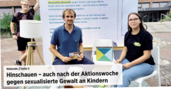
Hinschauen – auch nach der Aktionswoche gegen sexualisierte Gewalt an Kindern

LAUFER Die Scherbröckel klagen über eine Zunahme der Gewalt gegen Kinder und Jugendliche. Sie fordern mehr Unterstützung von den Behörden und mehr Aufklärung über die Gefahren der Gewalt. Die Scherbröckel sind eine Initiative von Eltern, die sich für die Rechte ihrer Kinder einsetzen. Sie fordern mehr Unterstützung von den Behörden und mehr Aufklärung über die Gefahren der Gewalt.